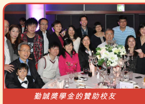
勤誠獎學金的贊助校友

小時候我們一家搬到九龍橫頭磡（今天的樂富）時，父母為我張羅入讀小學，街坊均推薦這所贏盡口碑的橫頭磡樂善堂小學。在這裏，我遇到好幾位良師，他們除了傳授知識，也教我做人的道理，更給我們分享他們做人處世的經歷。小學畢業前，當然也要面對升中選校，樂善堂余近卿中學是我的第一志願。結果，我在樂善堂這個搖籃足足十一個年頭。