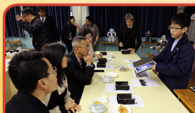
樂善堂余近卿中學學生向梁紹安主席及各位常務總理展示最新教學設備。

本堂現時轄屬單位超過35個，提供多項教育、醫療、安老及社會福利服務。本堂總理同寅於2016年1月20至21日一連兩日實地巡視部分單位，了解各單位最新發展情況，並與相關主管及同事交流意見，共同研究提供更優質的服務。