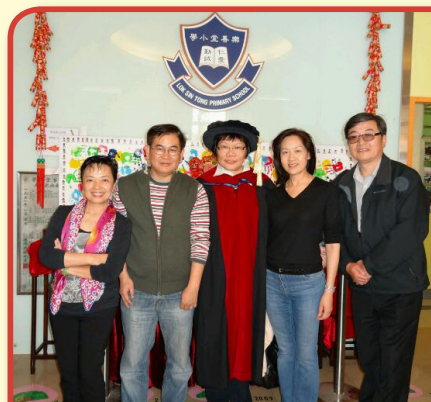
闊別四十年，明社校友重訪母校樂善堂中學（即今樂善堂小學校舍），懷緬昔日校園時光

樂中於1982年遷校，發展為今天的王中，轉眼又過了33個年頭。為了連繫樂中校友，何校長於2004年舉行「校友夜」，邀請樂中、王中校友相聚聯誼；其後又修改校友會會章，歡迎樂中校友加入王中校友會，實現樂中王中一家親的夢想。因此，雖然校舍已遷、校名已改，但新舊兩校情誼跨越時空，延續不斷。在此祝賀明社畢業40周年快樂、眾校友身體健康、與母校多加聯繫！