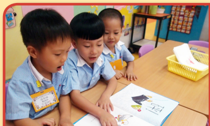
幼兒齊齊閱讀故事，了解故事內容