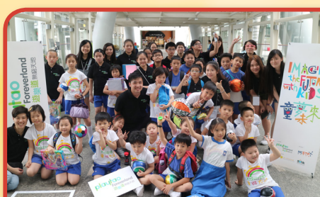
「童遊大道」大型攤位遊戲活動

本校以發展優質、多元而均衡的教育服務為宗旨，並以「仁、愛、勤、誠」為校訓，培養學生身體力行；以「德、智、體、羣、美」五育為課程綱領，塑造完美人格，開創豐盛人生。以培養學生成為一個有「自治、自省、自學能力」的人為教育目標。透過教職員的熱誠及努力、家校的緊密合作，校園溫情洋溢，關愛共融的文化已然建立。