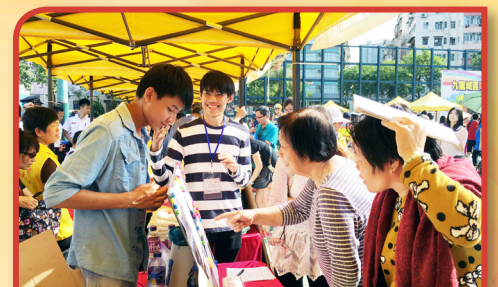
少數族裔青少年義工服務，介紹少數族裔文化