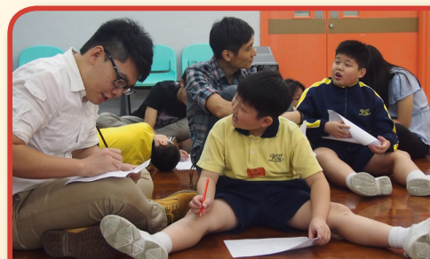
共同訂立成長大計

本校今年開展了兒童發展基金之「我的成長嚮導」計劃。計劃為期三年，旨在鼓勵參加計劃的兒童規劃未來、養成建立儲蓄和無形資產的習慣（例如正面態度、個人抗逆能力和才能，以及社交網絡等）。此計劃更為每位學生配對一位友師，協助他們實踐目標及成長。我們希望透過工作坊、參觀、日營、歷奇活動等，提升他們的自信心及抗逆力，有助參與計劃的同學的長遠發展。