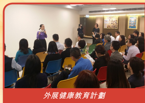
外展健康教育計劃