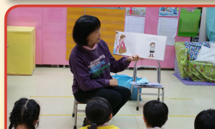
特殊幼兒工作人員透過講故事，讓小朋友學習如何處理自己情緒。