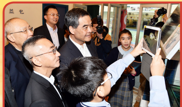
余近卿中學學生向梁特首展示最新教學設備