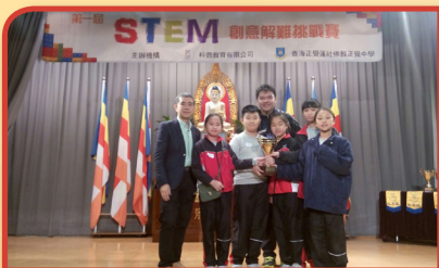
本校學生在STEM創意解難挑戰賽中獲得冠軍

樂善堂梁鈺琚學校（分校）近年積極推動資優教育，除了在課程中加入資優教育的元素，提升學生的高層次思維能力，亦著意發掘學生的潛能，為不同範疇的資優生提供多元智能班，讓他們得到重點的培訓，同時亦推薦學生參與資優教育學院的課程，好讓每位資優學生的潛能得以發揮，並展現他們的光芒。