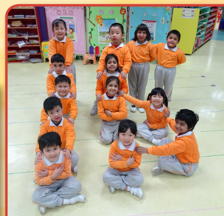
學生齊心賀校園，快樂成長創未來。