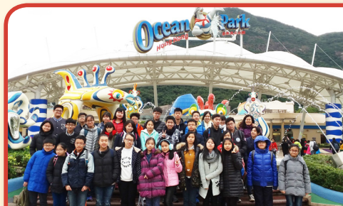
圖書館海洋公園一日遊2016

此外，本校於2015年11月獲甘肅省校長團探訪，以了解香港推行德育課之情況，過程中本校向校長團展示本校品格架構和課程發展，亦開放「城市論壇」課堂，學生透過角色扮演，訓練理性思考與同理心，回應尊重、關懷等品格。探訪除有助兩地交流，亦促進本校品格教育之檢視。