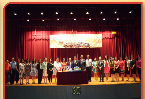
「FUN•享•愛~~共慶樂校65周年」 《情尋樂校》啟動禮