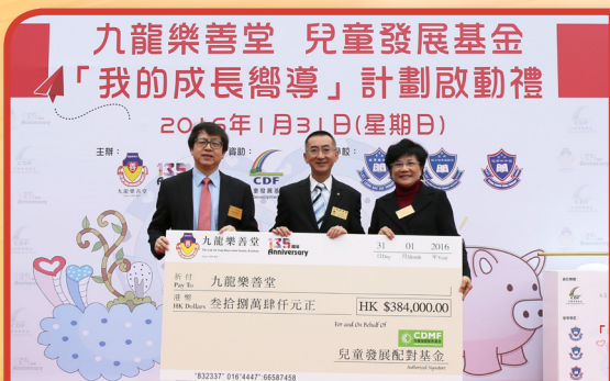
計劃獲兒童發展配對基金捐出港幣38萬4千元，資助參與計劃學生的儲蓄配對金。

兒童發展基金「我的成長嚮導」計劃啟動禮於2016年1月31日假天水圍天瑞商場舉行，邀得勞工及福利局副局長蕭偉強太平紳士擔任主禮嘉賓，聯同九龍樂善堂主席梁紹安先生、兒童發展配對基金及青少年發展企業聯盟主席陳龔偉瑩女士、藝人狄易達等一同主持啟動儀式。當日近300名參與計劃之學生、家長和友師到場支持，場面熱鬧。