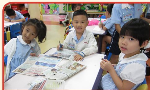
合作在報紙上找出文字創作句子

本校一向以幼兒為中心，課程編排著重幼兒德、智、體、群、美全面發展，以遊戲為策略教導其知識、技能、態度三方面。透過生活經驗及故事，引導幼兒思考，發展其邏輯思維及解難能力。亦因應幼兒興趣進行「專題研習」，讓幼兒對學習產生興趣及主動性。在美藝發展方面，教師以小組形式教授，讓幼兒學習有關技巧及知識，培養其創造力、觀察力及對美的欣賞。此外，全校均設有寬頻及Wi-Fi上網，幼兒可透過電腦白板進行網上學習。家長亦可利用與學校合作之「教育資訊平台」進行親子學習，包括：互動常識、寶寶看世界等。