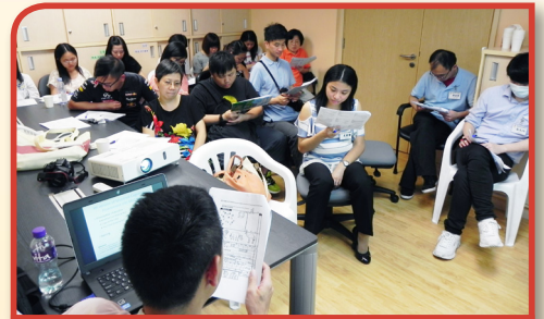
邀請各長者服務單位的員工到本院舉行講座及研討，一同研究腦退化症的評估工具。

有關研討會把不同專業職系的員工連結，透過不同專業範疇的意見交流，使員工更全面了解腦退化症長者的獨特行為，從而以更有效的方式跟進及協助有關個案。藉著是次與耆智園的合作，為院舍提供有系統的腦退化症服務定立了基礎。