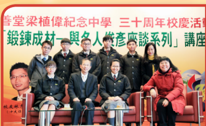
立法會主席曾鈺成蒞臨主講 「鍛鍊成材——與名人俊彥」講座

此外，本校銳意推動探究學習，啟發創意，專題研習最能啟發同學的思考及高階思維，中國歷史科及通識科歷年培養學生專題探究能力，推動學生參加校外專題研習比賽，獲獎無數。本年度，中國歷史科參加「第四屆校際香港歷史文化專題研習比賽」，以「獅子山下的『油』情冠珍」及「麵條生機好到底」為題，分別囊括初級組（多媒體製作）及高中組雙冠軍，可喜可賀。同時，足球校隊連續兩年勇奪葵青區足球錦標賽男子甲組冠軍，進入全港學界精英賽，師生同感鼓舞。