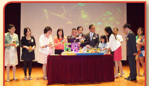
校慶典禮暨「情尋樂校」校慶劇啟動儀式，共同以LEGO拼砌夢想中的校園