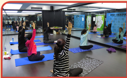
以深受女士歡迎的瑜伽帶出「靜觀」概念

本堂致力推動戒煙服務，關注近年本港女性吸煙率有上升趨勢，於2015年自資近200萬元推出為期一年的「WISE在職女性戒煙計劃」，夥拍香港大學公共衛生學院、護理學院及心理學系，主動為女性煙民提供針對性的戒煙服務，內容包括由專業團隊提供外展形式煙害講座、工作坊及個別電話跟進，費用全免。計劃首創以「靜觀」療法訓練女煙民以意志力戒煙，再加入壓力管理及生涯規劃等元素強化戒煙成效。計劃於短短一年間服務超過200名吸煙女性。