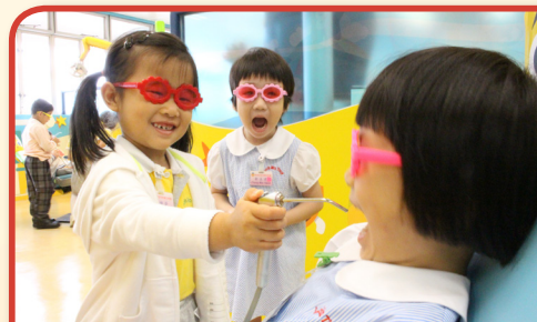
幼兒變成小牙醫檢查牙齒

從是次的參觀活動，體會到幼兒的學習是主動、積極的，作為教育工作者的一份子，應時刻將幼兒的學習放在首位。本校將繼續透過有趣、新穎的方法讓幼兒學習，從小培養主動學習的精神。