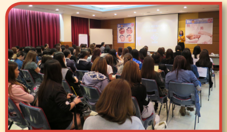
為女性員工而設的煙害講座