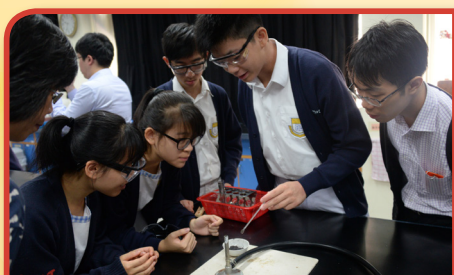
進行實驗，探索化學知識，建構科學技能