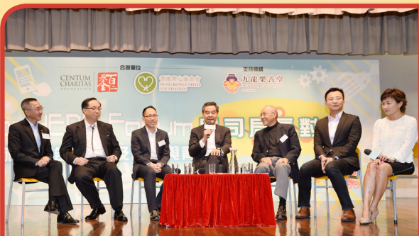
行政長官梁振英先生(中)及嘉賓們到樂善堂余近卿中學出席論壇

由百仁基金與齊心基金會合辦，並獲本堂全力支持的「beHERO Forum 與司局長對話」活動於2016年2月22日假本堂轄屬樂善堂余近卿中學舉行，現場近800位轄屬中學學生與行政長官梁振英大紫荊勳賢GBS太平紳士以及創新及科技局局長楊偉雄先生就著創新科技作現場討論，另逾2,200位學生則觀看現場直播及電話答問，同學與特首及局長答問熱烈，獲益良多。特首梁振英先生與學生暢談時，建議學生可看Tesla創辦人Elon Musk的自傳，他更願自掏腰包送書給學生們，並道：「大家不是要看Elon Musk怎樣成功，而是看他怎樣失敗，在失敗之後的嘗試。」