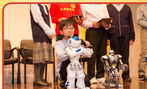
長者與學生合作操控機械人主持啟動儀式