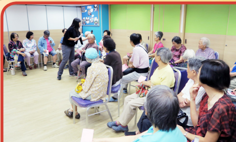
中心舉辦慶祝父母親節的活動，讓護老者及長者共度佳節。

本中心為了配合轉型服務，增設護老者支援服務。服務目標是紓緩護老者照顧長者所面對的問題及壓力。凡照顧長者之區內人士，均可免費登記成為護老者會員，便可獲得中心提供的資訊及參與為護老者提供的減壓小組及活動。每月安排不同的主題聚會，如：「與情緒對話」、「我要鬆一鬆」、「輕鬆聚一聚」等。除此之外，中心亦安排護老者參觀「耆智園」，提升他們對認知障礙症的關注及了解，以及舉辦「安全扶抱及轉移技巧」講座，提升護老者及家傭的照顧技巧。由於照顧體弱的長者時，需要輔助工具來協助，中心有見及此，購入一批全新的復康用具，讓已登記合資格的護老者免費借用，包括電動輪椅、手推輪椅、摺疊式拐杖、沐浴便椅、四腳拐杖、減壓坐墊、盤骨固定器及助行架等。