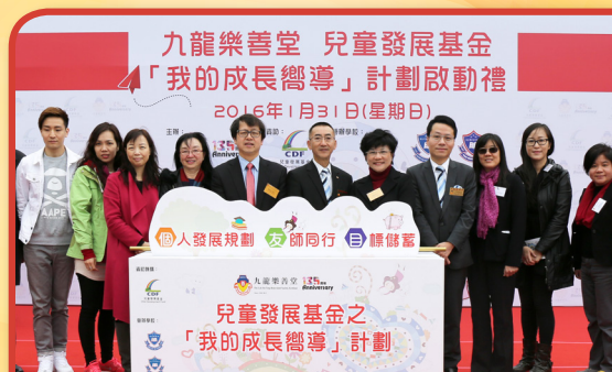
主禮嘉賓蕭副局長(左五)、梁主席及一眾嘉賓，主持計劃的啟動儀式，共同見證重要的時刻。