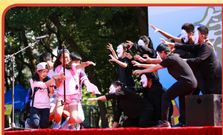
閱讀嘉年華話劇比賽季軍

本校著重學生的全人發展，提供多元化課程及學習機會，因參與九龍倉集團「學校起動計劃」而獲資助，進一步加強學生品德、潛能發展及學業等學生成長支援；如英文科籌辦英語音樂劇「阿拉丁」，由專業導師教授學生，以英語樂曲、歌詞、戲劇及舞蹈等活動形式，啟發學生英語學習能力和興趣，營造校園英語學習氛圍。