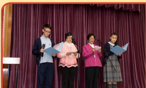
長者與學生合作擔任司儀

樂善蓮社創新長者學苑之啟動禮已於2015年12月5日舉行，承蒙社會福利署助理署長(安老服務)彭潔玲女士及九龍樂善堂主席梁紹安先生蒞臨主禮。當日活動內容豐富，包括長幼共融的粵曲及醒獅表演。場內數百嘉賓、長者、師生更進行愛笑瑜伽及大合唱，共同度過一個難忘而有意義的啟動禮。