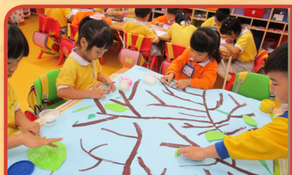
幼兒繪畫一個樹林給小樹熊居住 (配合美藝創意)

本校持續以美國「啟發潛能教育」的理念，將關愛、尊重、信任、樂觀的態度內化於校園中，並於2015年再獲得國際啟發潛能協會頒發「學校成就大獎」(1 st Silver Fidelity Award)。另外，亦關注幼兒的脊骨健康，持續於早會及午會，讓學生進行護脊操，並於2015年獲兒童脊科基金頒發「積極推廣脊骨神經健康及課間護脊操」成效卓越獎。