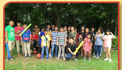
少數族裔青少年禁毒訓練日營

中心獲得公民教育委員會資助，舉辦「多元樂繽紛-文化體驗活動計劃」，向本地青少年，包括中小學生及大專生，推廣多元文化，增加他們對少數族裔文化的了解及學習尊重和包容。活動包括：考察有「小泰國」之稱九龍城城南道、不同的宗教場所，與少數族裔人士交流，舉辦多元文化興趣班，到學校舉行展覽及展示民族服飾等，參加者超過2,300人。