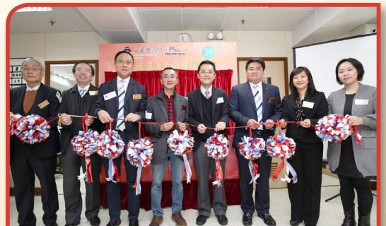
主禮嘉賓衛生署助理署長(中醫藥)林文健醫生與眾嘉賓為樂善堂李施紅娘中醫診所進行剪綵儀式。

為應付本堂日益增辦之慈善服務，本堂總辦事處早已不敷應用，窒礙本堂持續發展，自2013年起本堂開展研究重建計劃，該計劃為本堂將來十年之重點項目，希望社會各界繼續支持本堂。最後，本人特別感謝各界多年來支持，樂善堂定必繼往開來、與時並進，為廣大市民提供更多適切服務。