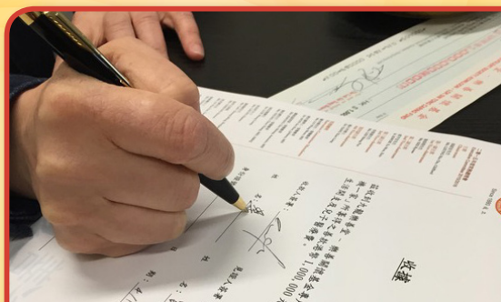
專戶為意外家屬籌得合共100萬元港幣，於校方見證下，家屬簽收支票。

當中發生於2015年12月之落馬洲致命交通意外，死者為本堂屬校學生父親，由於學生身患重肌無力症，家庭頓失依靠，本堂得悉事件後已即時於「樂善關懷基金」撥出港幣5萬元作緊急經濟援助。同時考慮到家屬日後將面臨生活、醫療及改裝家居設備等開支，生活捉襟見肘。為此，本堂特設立捐款專戶為家屬籌募善款，事件獲得市民廣泛關注，本堂最終為家屬籌得港幣100萬元，並於校方見證下將支票交予家屬。