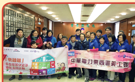
計劃獲得中電的支持，派出專業義工隊到長者屋企檢查及維修固定的電力裝置，以及更換照明設備。