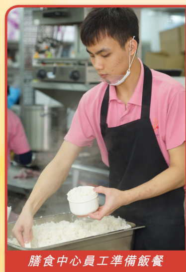
膳食中心員工準備飯餐

樂「膳」堂營養膳食中心自2014年3月投入服務，以社會企業形式營運，為有需要的長者、剛離院人士及長期病患者，提供高質素營養膳食送遞服務，近年擴大服務對象至不同志願機構、社區團體及上班一族等。為方便護老者及家人安排長者膳食，中心設立「易訂網」，55歲或以上長者可網上登記使用膳食送遞服務。中心亦提供多元化派對餐飲美食，如中西式及時令節日食品，客戶包括大小企業、團體及政府部門等。