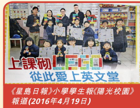
《星島日報》小學學生報《陽光校園》 報道(2016年4月19日)

樂校重視創藝教育，在盛大的65周年校慶活動中，各組別於「情尋樂校」的演出中展現各範疇的學習成果。樂校積極為學生創設情境，透過LEGO FUN PROGRAM，提升學生學習英語的興趣和信心。此外，學生透過眾多多元化的全方位學習經歷，得以全人發展，實現「愉愉快快學習，健健康康成長」(Happy Learning and Healthy Growing)的願景，成就樂校成為一所啟發潛能的健康校園！