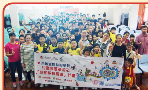
我的成長嚮導計劃宣誓日