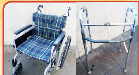
為協助護老者照顧體弱及行動不便的長者，中心提供免費借用助行架、手推輪椅等復康用具。