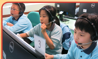
英語朗讀輔助軟件，有效提高 學生的朗讀流暢度。

以現代科技優化學與教是梁蕙芳紀念學校團隊近十年的努力方向。現時，該校的內聯學習平台已上載了多元化的電子自學軟件和材料，學生可透過內聯平台進行自學或輔助學習。