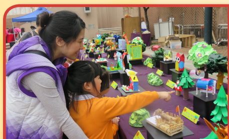
樂善「童」德美藝行嘉年華