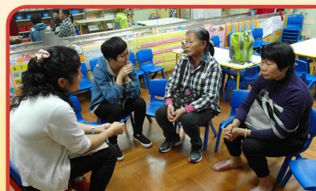
家長交流教子心得