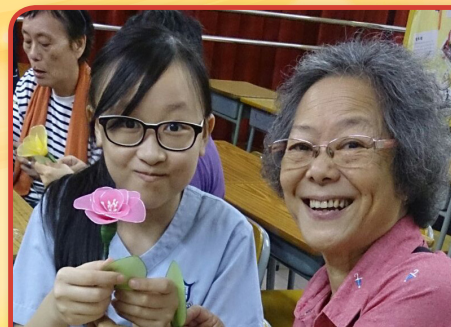
老友記與余中同學合力完成作品，展露滿足笑容。