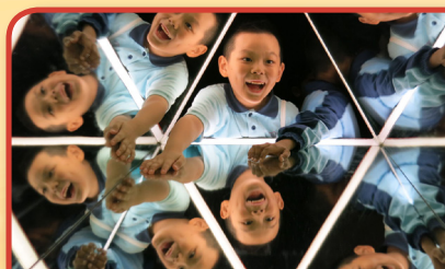
三菱鏡感悟——人生多面睇