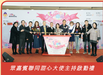
眾嘉賓聯同甜心大使主持啟動禮

樂善糖甜心行動為本堂年度旗艦籌款項目，每年均於3月份舉行，為期2個星期，本年度於2016年3月12、13、19、20日於全港指定的港鐵站、商場及戶外銷售點進行義賣。同時，為隆重其事，本堂更於義賣首日於將軍澳廣場舉行活動啟動禮，活動甜心大使Super Girls及陳詩欣亦到場與總理們一同為活動揭開序幕，並即場進行義賣。