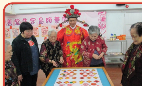
活動上，財神爺陪同院友玩遊戲。

中國人對節慶十分重視，凡是過時過節，總會一家團聚齊齊整整的慶祝一番。長者尊重中國文化，喜聯繫親情，而歡慶的節日會為長者帶出未來的願景，所以頤養院亦重視每個中、西節日，如農曆新年、父母親節、端午節、中秋節、長者日、冬至及聖誕節等，均會為院內長者安排慶祝活動。院友可以在這些慶祝活動當中和嫦娥姐姐、聖誕老人及財神爺一同玩遊戲。另外，又可以在一些節日時親手製作一些傳統的食品：例如包粽子和油角等。院友亦可以在各個節日享用頤養院廚師為他們精心預備的過節午宴，讓長者雖然已離開自己的家庭而入住頤養院，卻仍然可以享受節日的歡愉，且不是獨個兒的過節，而是與院舍職員和其他院友一同歡聚共渡佳節。盼望我們頤養院內的所有院友們都能繼續保持對節日傳統的喜愛而樂在其中。