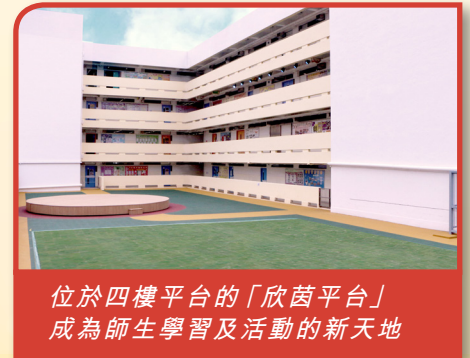
位於四樓平台的「欣茵平台」 成為師生學習及活動的新天地