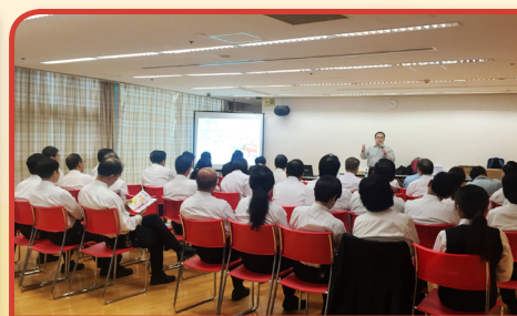
到訪不同企業為前線員工提供煙害講座