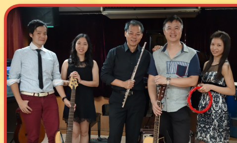
多謝一班專業音樂演奏義工給長者分享音樂

記得在首場鋼琴獨奏會中，長者聽得十分投入，雖然樂曲不是他們聽慣的『帝女花』，但當奏完『土耳其進行曲』的最後一個音時，他們都不其然地歡呼起來。對了，這就是音樂的感染力！—— 我們知道音樂分享會系列一定要繼續下去！