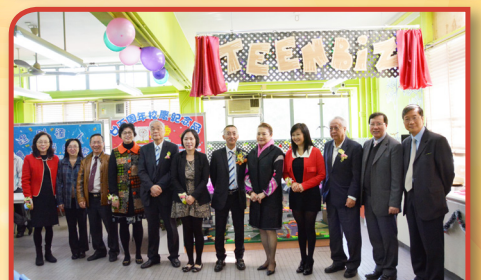
「商薈開幕典禮」— 「商薈」為一由學生統籌及營運之校內商業體驗組織，並於廿五周年銀禧校慶當天由眾嘉賓主持揭幕後正式營業