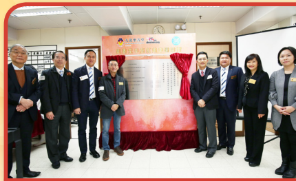
眾嘉賓一同進行診所揭幕儀式

為了迎合社會對中醫服務的需求，本堂得到李聖潑副主席贊助，於旺角上海街688號鎮海商業大廈3樓開辦「樂善堂李施紅娘中醫診所」。診所於本年1月11日開始營運，由註冊中醫師提供全科、針灸及天灸服務。為隆重其事，本堂於3月14日舉辦診所開幕禮，當日有幸邀得衛生署助理署長(中醫藥)林文健醫生為主禮嘉賓，為診所正式投入服務揭開序幕。為響應「欣賞香港」活動，新診所於開幕禮後一連三天提供義診服務，免除診金及藥費，秉承「贈醫施藥」的宗旨，為更多社區人士提供優質的中醫服務，促進身心健康。