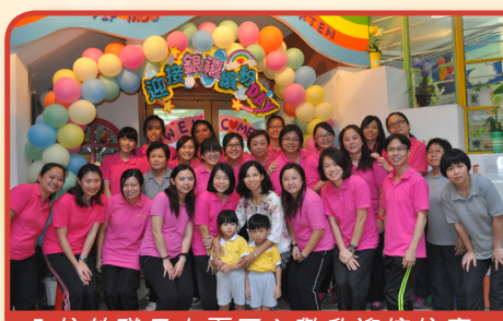
全校教職員上下同心歡欣迎接校慶