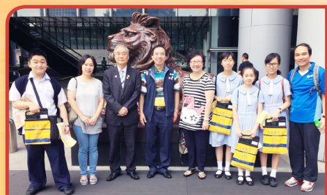
總理打氣團特意到訪各區，對參與樂善堂賣旗日之義工給予鼓勵。