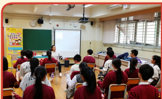
工作坊 體適能與腦退化症

本堂獲食物及衛生局健康護理及促進基金資助，於2015年10月起推行為期一年的「認識及關注腦退化症－青年起動」健康推廣計劃。計劃旨在透過講座及工作坊培訓青少年，提升他們對「腦退化症」的認識及關注，並組織長者關懷大使，實踐關顧長者活動，加強青少年在社區擔任推廣關顧長者的角色。計劃內容除了專題講座及工作坊之外，亦會製作「腦退化症」知識指南、舉辦「腦退化症」資訊展覽及「拼貼藝術創作」，以提升公眾對長者及腦退化症的關注。