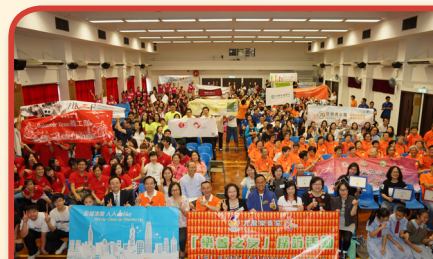
樂善之友幸得各界支持，服務才可持續。樂善堂冀望義工於服務過程中有所得著，共同成長。

「樂善之友」至今累積參與服務人次達8000多人。單計2015年度之義工服務，合作的企業及團體已多達60多個，參與界別包括：專上學院、銀行金融界、地產界、飲食集團、公共交通工具營辦商、美容界、物業管理公司、清潔公司、工程公司等中小企業，以及各政府部門義工隊等，匯聚各界力量，「樂善之友」仍會持續提供義務工作機會，與社會各界人士聯手合作，將服務力量發揮至最大。