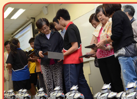
學生協助長者利用平板操控機械人。