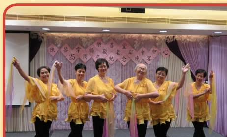
25周年晚宴上，長者表演絲巾舞

為慶祝「樂善堂陳黎掌嬌敬老鄰舍中心」成立25周年。中心於2015年10月29日晚上於銅鑼灣皇室堡5樓稻香超級漁港舉行25周年晚宴。活動當晚共有190名會員及18名護老者，共208名參加者出席。當晚中心安排會員進行絲巾舞、橡筋帶及視差舞表演。此外，中心更邀請到九龍樂善堂主席梁紹安先生、副主席施家殷先生及司庫羅永順先生等嘉賓頒發長期服務義工獎。當晚嘉賓們共抽出超過50份名貴禮物，加上中心亦為每位出席者送上蘑菇拍拍燈及25周年特刊作為紀念。每位出席者均滿載而歸，皆大歡喜，樂也融融。