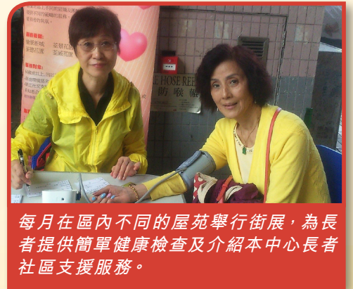
每月在區內不同的屋苑舉行街展，為長者提供簡單健康檢查及介紹本中心長者社區支援服務。

去年本支援服務成功為72位長者提供個案輔導，而當中更超過三成的個案乃從街展中發掘，成效理想。而受助長者除獲得適切的服務或資助外，更表示感覺到被受尊重及關懷。