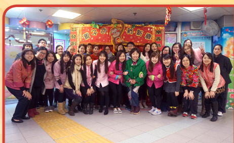
老師融洽齊互勉，春風化雨育英才。

本校一直重視培養學生全人發展，以啟發兒童潛能及安排學生參與不同比賽，豐富幼兒的學習經驗，助他們建立自信心，並提升師生的教學效能。我們將持續以學生為本，繼續為「育才」而努力。