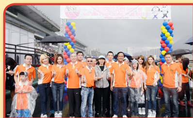
一眾嘉賓帶領參加者起步。

萬人行自1998年舉辦至今已有了18年，每年均吸引逾萬名來自本堂轄屬單位、各界企業及團體的參加者。本年度萬人行於2015年11月7日假沙田馬場舉行，邀得社會福利署署長葉文娟太平紳士親臨主持開步禮，並由人氣女子組合As One擔任慈善步行大使，以勁歌熱舞為參加者打氣。隨後，一眾參加者由金龍醒獅帶領下起步，沿城門河步行至沙田公園。整個活動為本堂教育、醫療、安老及社會福利服務籌得過百萬元善款。