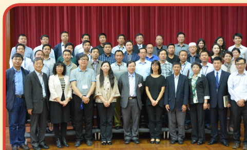
「甘肅校長團訪校」— 甘肅省中、小學校長蒞臨本校參觀，及於觀課後與本校師生分享教與學心得