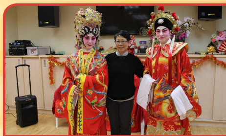
院慶二週年活動—雅善粵劇表演掀起活動高潮

本院於2016年1月14日舉行本院成立週年之院慶活動，當日氣氛非常熱鬧。大部份院友參與了當日上午之團體聚餐，同時舉行唱歌活動及抽獎遊戲，令院友感到十分高興。另外，當日下午亦邀得信義舞獅隊打出第二週年院慶的氣勢。之後一群熱心的義工為院友載歌載舞，雅善粵劇團的表演更掀起高潮，院友興奮鼓掌。最後院友們得到由善心家人贊助的院慶禮物，院慶活動亦告一段落。