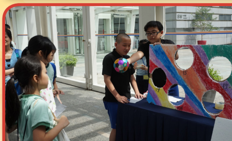
同學細心講解遊戲玩法

本校以發展優質、多元而均衡的教育服務為宗旨，並以「仁、愛、勤、誠」為校訓，培養學生身體力行；以「德、智、體、羣、美」五育為課程綱領，塑造完美人格，開創豐盛人生。以培養學生成為一個有「自治、自省、自學能力」的人為教育目標。透過教職員的熱誠及努力、家校的緊密合作，校園溫情洋溢，關愛共融的文化已然建立。