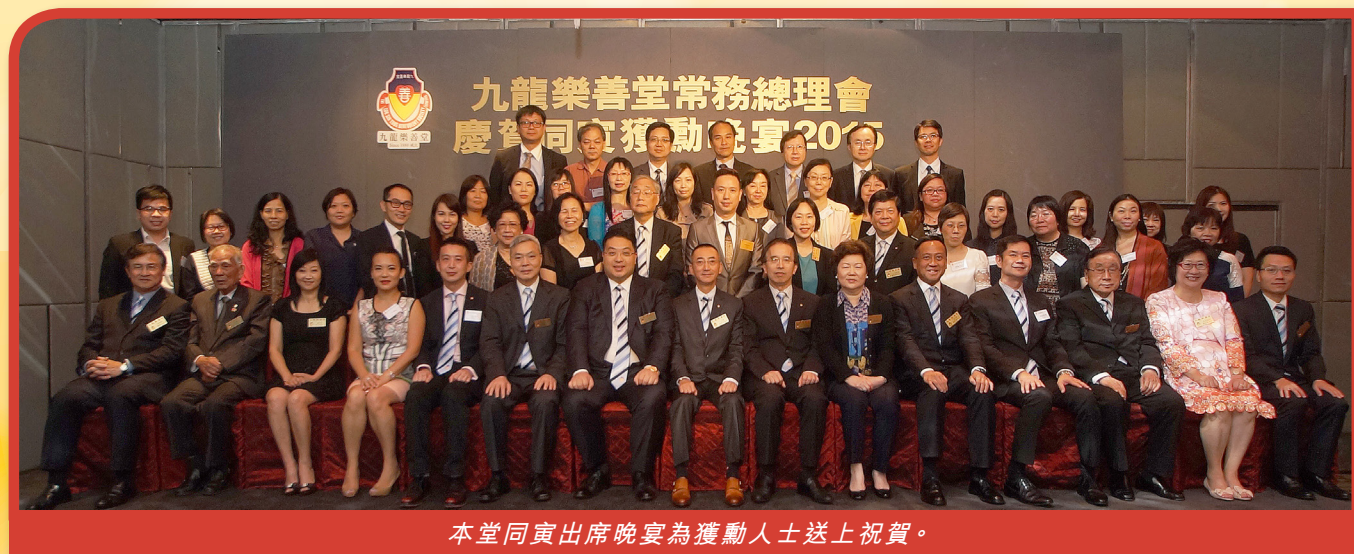
本堂同寅出席晚宴為獲勳人士送上祝賀。