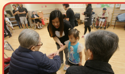
關心社區不限年齡，樂善之友鼓勵義工以親子形式參與服務，一起散播歡樂。