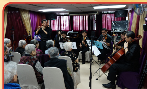
長者聽得十分投入