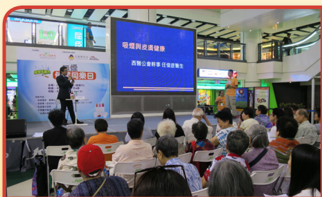
第六屆「戒煙大贏家」－無煙健康同樂日

本堂自2013年以來獲衛生署控煙辦公室的資助，聯同香港大學護理學院、公共衛生學院及心理學系，推出為期兩年的「愛•無煙」前線企業員工戒煙計劃，由專業團隊以外展形式主動到訪不同的大中小企業進行煙害講座及健康檢查、協助企業制定內部無煙政策、舉辦戒煙工作坊及提供專業戒煙輔導服務，吸引不少企業積極參與推動無煙工作間。自推出計劃以來已超過200間企業參與，服務超過1100位吸煙者，反應非常熱烈。新一輪2015-16年度計劃現正推行中。