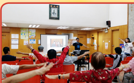
「快樂方程」情緒管理講座

本堂舉辦太極興趣班，期望參加者透過活動強身健體之餘，亦可藉太極班放鬆心情，活在當下，達到身心健康。