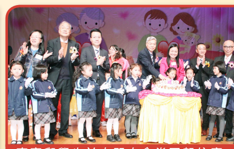
嘉賓與學生於屯門大會堂同賀校慶