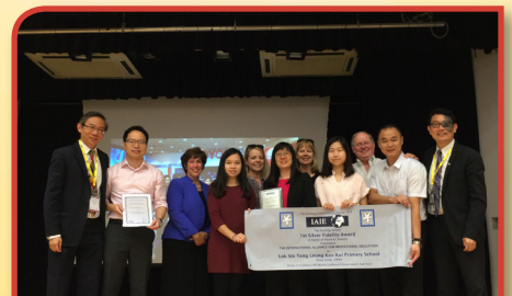
2014年榮獲國際啟發潛能教育聯盟頒發「國際啟發潛能學校大獎」及2015年「國際啟發潛能成就大獎」