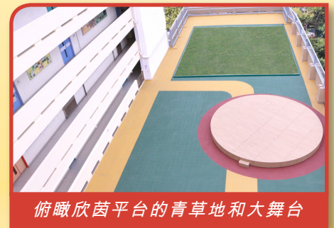
俯瞰欣茵平台的青草地和大舞台