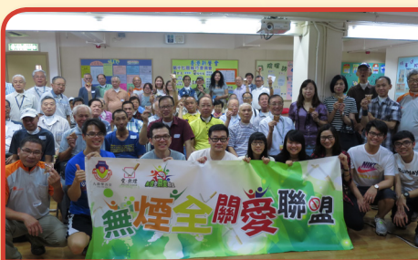
與「香港新聲會」合辦義工探訪活動