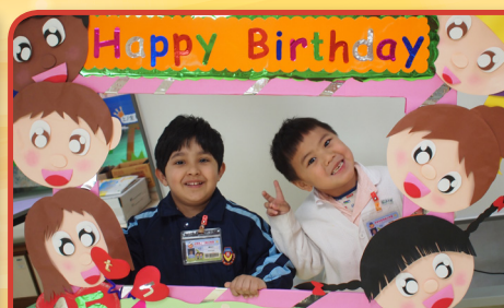
Happy Birthday to you !