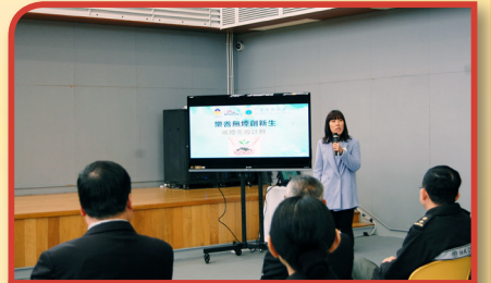
計劃社工向嘉賓介紹計劃內容

九龍樂善堂自資30萬元，與香港懲教署合作，於去年11月首辦為期一年之「樂善無煙創新生」戒煙更生先導計劃，透過外展服務到監獄為在囚女煙民提供戒煙服務，協助她們身心更生，將來重投社會。計劃以羅湖懲教所女子監獄為先導計劃地點，透過非藥物治療的靜觀訓練、認知行為治療及動機式談話三項介入方式，為在囚女煙民提供免費戒煙服務，包括以外展形式舉辦戒煙工作坊、面談輔導、大型健康講座及深化活動，包括預防復吸講座等等，受惠人數達250人。