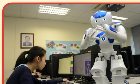
同學專注地編寫機械人NAO的指令