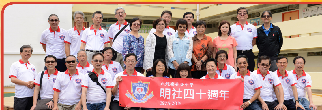
明社校友於王中全新「欣茵平台」留影

樂中於1982年遷校，發展為今天的王中，轉眼又過了33個年頭。為了連繫樂中校友，何校長於2004年舉行「校友夜」，邀請樂中、王中校友相聚聯誼；其後又修改校友會會章，歡迎樂中校友加入王中校友會，實現樂中王中一家親的夢想。因此，雖然校舍已遷、校名已改，但新舊兩校情誼跨越時空，延續不斷。在此祝賀明社畢業40周年快樂、眾校友身體健康、與母校多加聯繫！