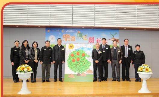
「樂善無煙創新生」嘉許禮邀請到懲教署助理署長鄧秉明先生及多名懲教署高級監督等出席，與參加者家屬一同見證在囚女煙民的戒煙成果。

同時，本堂更於2015年11月與香港懲教署合作，自資30萬元首辦「樂善無煙創新生」戒煙更生先導計劃，以羅湖懲教所女子監獄為計劃試點，透過外展服務到監獄為在囚女煙民提供戒煙服務，協助他們身心更生，為重投社會做好準備。計劃至今，成功戒煙率為100%，實有賴各方協作。