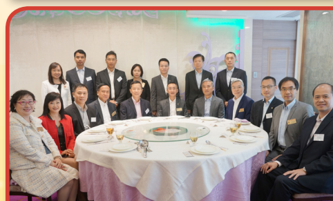
本堂總理與消防處處長黎文軒先生FSDSM(前排左五)及長官會面交流。