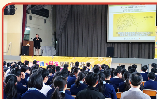
專題講座 「青少年在服務腦退化症患者中的角色」