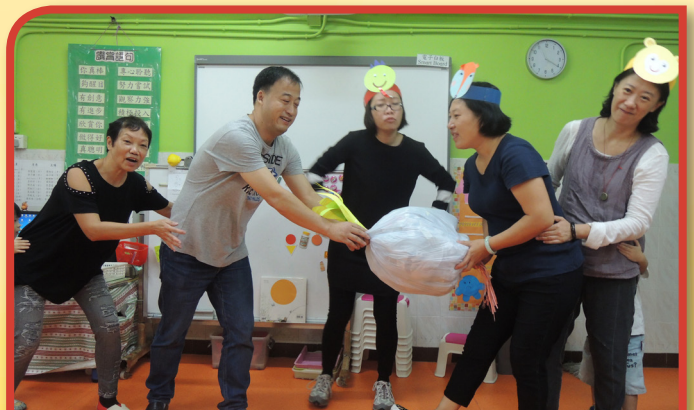
故事爸媽到校講述故事給幼兒欣賞