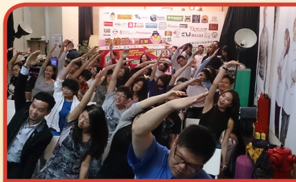
以外展形式進行靜觀工作坊