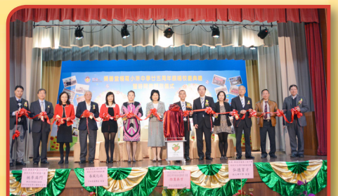
「廿五周年銀禧校慶典禮」— 得蒙楊葛小琳女士撥冗親臨學校探訪師生及主持廿五周年銀禧校慶揭幕儀式

典禮翌日是本校校慶開放日，學生負責設計攤位遊戲和體驗活動，參與者更可贏取由家長教師會製作的禮物。楊中校友會在同日亦舉辦了校友會盃籃球賽，以及盆菜派對活動，得到各屆校友踴躍支持，晚上在操場進行的盆菜活動更可謂座無虛席，筵開42席，多達500位師生參與，共同慶賀楊中25歲壽辰。開放日能順利完成，體現本校學生、教師、教職員、家長及校友對楊中的歸屬感與愛護之情。