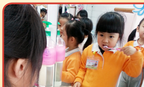
在學校裡實踐刷牙活動