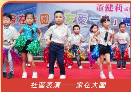
社區表演——家在大園

為改善及提升學校教育質素，幼稚園引入「啟發潛能教育」(Invitational Education) 理念為學校發展的元素，此理念是深信所有人都是有能力、有價值、有責任的。學校在制定教育目標、課程安排、評估制度等均引用「啟發潛能教育」的理念，強調透過政策、地方、人物、計劃及過程五個方向，為兒童營造愉快的學習環境，啟發他們的潛能。