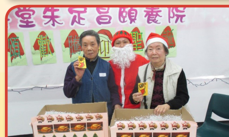
聖誕老人與院友一同度過普天同慶的聖誕節。