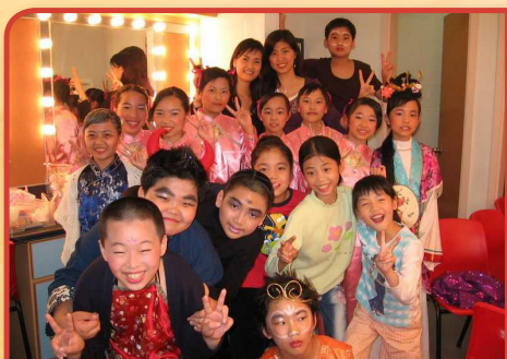
55周年校慶劇《大樹頭下話西遊》， 圖左穿藍色小旗袍的是樹頭婆婆

遙知不是雪，為有暗香來！很想相信，仍然因着有一些人經年懷抱對樂校念念不忘的情義，讓樂校能抵過霜雪，在冷風中兀自散發陣陣的幽香。