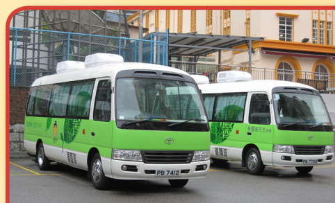
提供中醫全科及針灸服務

為針對缺乏中醫服務的區域及偏遠區域之醫療服務需求，本堂於南區、九龍城區、黃大仙區、大埔區及屯門區設立流動中醫診所服務點，以醫療車深入社區為市民提供中醫全科、免費中醫諮詢、針灸及天灸療法等服務，並採用中藥濃縮顆粒沖劑，方便沖服飲用。同時為了讓更多社區人士可以使用服務，本堂由2015年起於3個服務點增設夜診服務，延長服務時間至晚上8時，所有服務使用者均可以預約形式，預定時間到診，以節省等候時間。