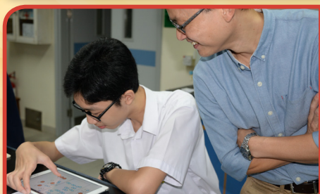
設計電子學習教材，提升學生自學能力