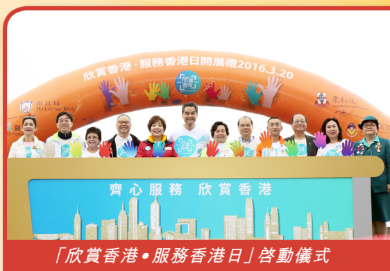
「欣賞香港・服務香港日」啟動儀式

當日上午大會於中西區海濱長廊 - 中環段舉行啟動禮，並由行政長官梁振英大紫荊勳賢GBS太平紳士主禮，聯同各善團主席一齊為活動揭開序幕。同日下午，各大善團於各區提供免費社會服務回饋市民，本堂當日分別於九龍城樂善堂李賢義裔群社 - 少數族裔支援服務中心派發糖果予少數族裔小朋友、於大埔樂善堂朱定昌頤養院派發健康水果予院舍長者，以及轄屬社企-樂「膳」堂營養膳食服務中心於土瓜灣區免費派發熱飯予市民，反應熱烈。