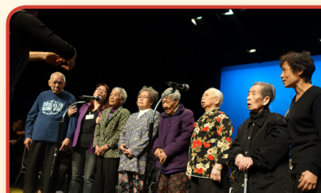
要天天要做到真快樂，每一刻都要記住，齊唱，同心唱.....

這個晚上，大家都不會忘記——專心致志、同心協力換來的滿足笑容。這個晚上，對於一班參與演出的院友是別具意義的，穿上戲服的每一刻，踏在舞台的每一步，眼前數百觀眾的注視，頭上灑落的舞台燈光，都是只有今宵的獨特經驗。讓院友在生命中擁有這份色彩，工作人員儘管忙碌，也覺快樂。陪伴著眾院友的還有樂善堂梁鈺琚大樂隊和他們非常精彩的表演，還有守候到音樂會的最後一刻的全場觀眾！