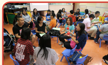
透過遊戲活動，讓家長們了解小朋友的需要及特性。

2016年，服務進一步拓展，並獲得善長支持，正式設立服務支援中心，於4月遷址旺角，除原有服務外，會透過不同的專業，提供更全面及多元化的支援。例如發展成人言語治療服務，對象包括因中風、腦部疾病或創傷所引致吞嚥障礙及言語障礙的人士，以及患腦退化症而引起失語症的人士，讓九龍城、黃大仙及油尖旺居住的長者及有言語治療需要的人士得到適切的服務。